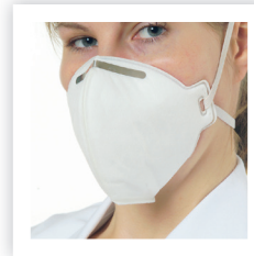
FFP2 / FFP3 ohne Ausatemventil