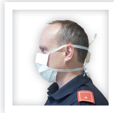
Mund-Nasen- Schutz- Maske