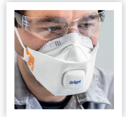
FFP2 / FFP3 mit Ausatemventil