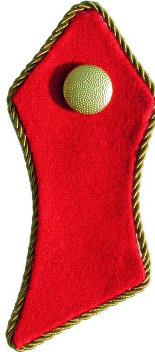
Paroli - Offiziere