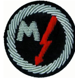
Maschinist und Elektriker