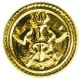
KDT - Knopf