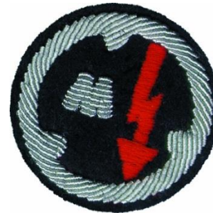
Kraftfahrer, Maschinist und Elektriker