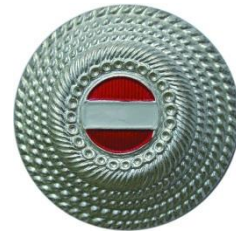
Mützenkokarde - Silber