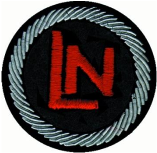
Lotens u. Nachrichten- dienst