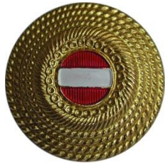
Mützenkokarde - Gold