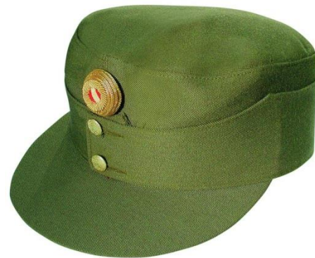
Kappe grün - Gold