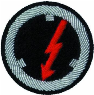
Kraftfahrer und Elektriker