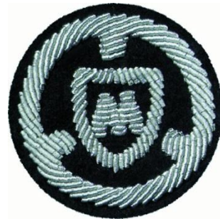
Kraftfahrer und Maschinist