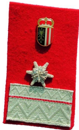
Bedienstete des Oö. LFV