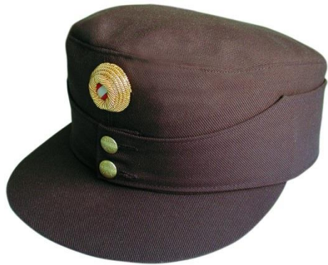
Kappe braun - Gold