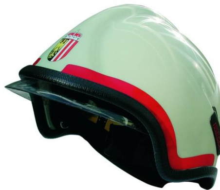
Helm – Mannschaft