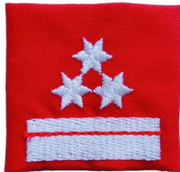
Schlaufe - Hauptbrandmeister