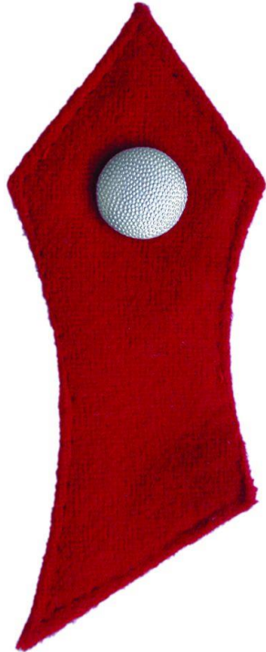
Paroli - Mannschaft