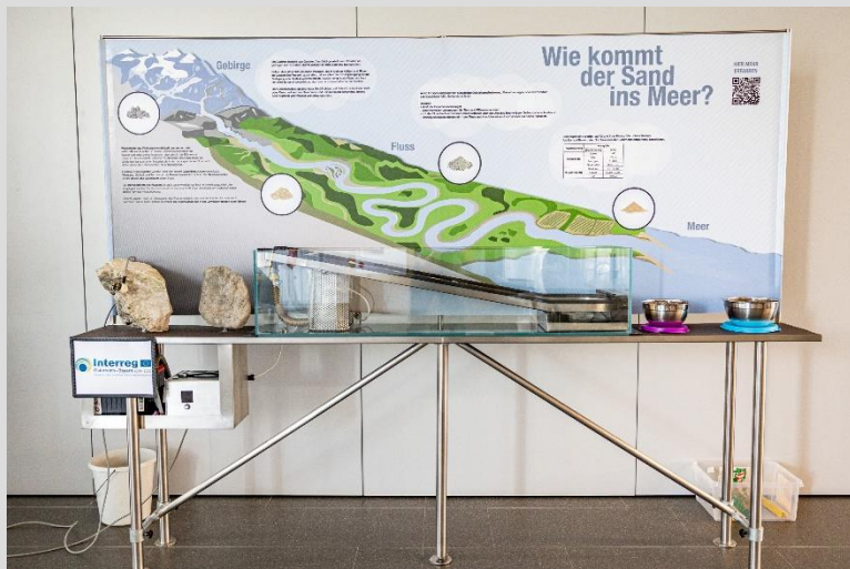
Flusssystem und Sedimenttransport