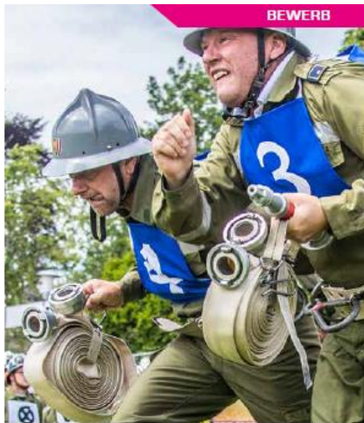
Volle Kraft voraus beim Löschangriff der Leistungsbeurteilung in Bronze und Silber – 2020 war von einem Totalausfall begleitet.