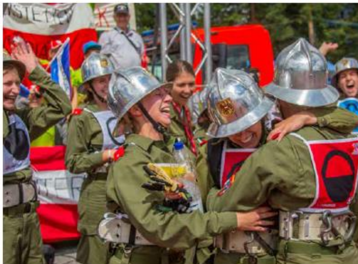
Bewerbe bedeuten aber auch viel Emotion und Motivation – unverzichtbare Menschlichkeitsfaktoren.

Sogar der Bundesfeuerwehrleistungsbewerb für Aktiv und Jugend wurde auf 2021 verschoben. Dem einen oder anderen geht durch den