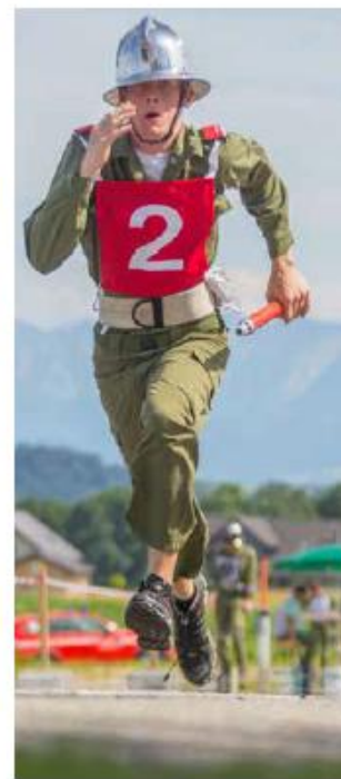
Die Staffellaufbahnen waren 2020 verwaist.

Die Kameradschaft und Zusammenhalt ist im Feuerwehrbereich ein wichtiger Motivationsfaktor. Im Bewerbswesen ist diese Kameradschaft besonders