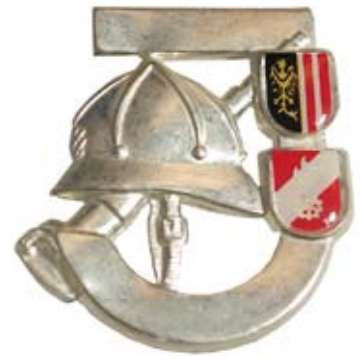
Feuerwehrjugend-Leistungsabzeichen in Silber (Landesbewerb)