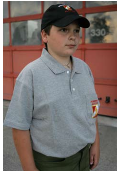
Jugendleibchen, hier die hellgraue Ausführung.

Auf der linken Seite kann das Feuerwehrjugend-Abzeichen, Größe bis höchstens 60 x 50 mm, aufgedruckt sein.