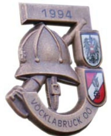
Feuerwehrjugend-Leistungsabzeichen in Bronze (Bundesbewerb)